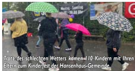
Trotz des schlechten Wetters kamen 110 Kindern mit Ihren Eltern zum Kinderfest der Hansenhaus-Gemeinde.