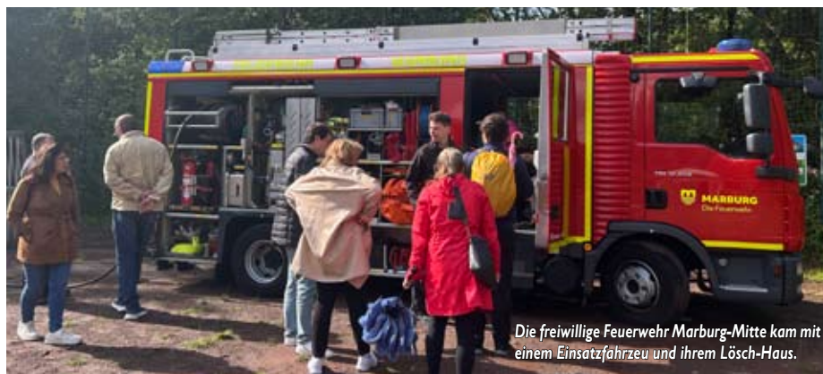
Die freiwillige Feuerwehr Marburg-Mitte kam mit einem Einsatzfahrzeug und ihrem Lösch-Haus.