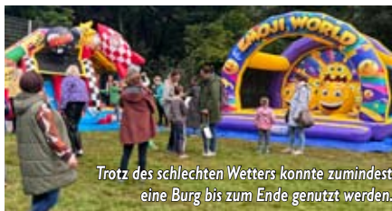
Trotz des schlechten Wetters konnte zumindest eine Burg bis zum Ende genutzt werden.