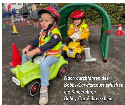
Nach durchfahren des Bobby-Car-Parcours erhielten die Kinder ihren Bobby-Car-Führerschein.