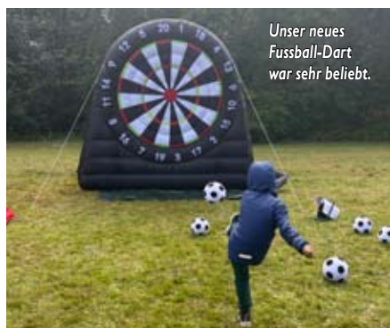
Unser neues Fussball-Dart war sehr beliebt.