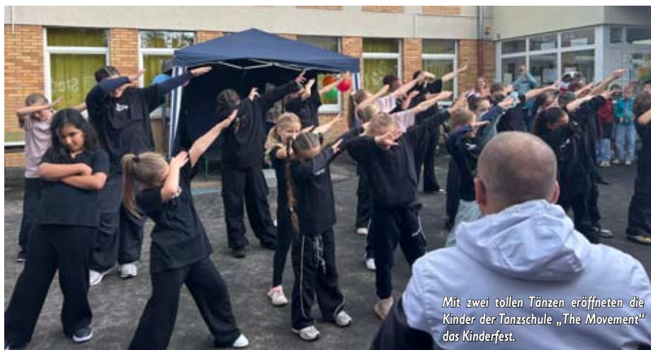
Mit zwei tollen Tänzen eröffneten die Kinder der Tanzschule „The Movement“ das Kinderfest.